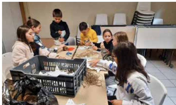
Préparation de décors de Noël