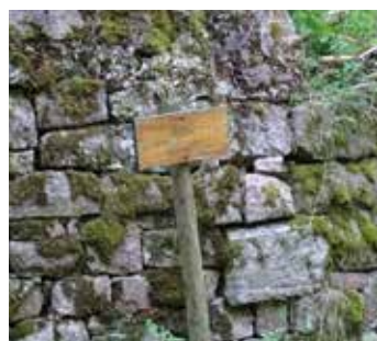
Panneau devant l'Igamurt Tann

En pénétrant sur le ban de Zimmerbach, il n'y a plus de signalétique. Nous empruntons à présent l'Oberer Boschtalweg. En poursuivant notre montée, nous rentrons sur le ban de Walbach à hauteur du Rocher du Corbeau. Après un léger faux plat la route remonte jusqu'au ban de Wihr-au-Val via l'Igamurt Tann. (voir photo à gauche).