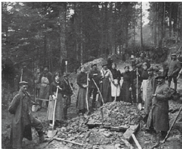
Construction de la Route Schmitt en forêt de Turckheim avec un groupe de travailleurs

Sur la photo ci-contre (transmise par la Société d'histoire de Turckheim) est représenté un groupe de travailleurs, encadré par des militaires. Cette photo date-t-elle d'avant ou de pendant la première Guerre Mondiale ? Est-ce que les travailleurs, dont des femmes, étaient-ils réquisitionnés ou étaient-ils payés pour cette construction ?