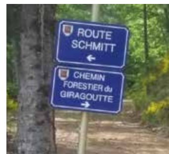
Sur le ban de Turckheim

La route Schmitt démarre en amont à Turckheim entre l'ancienne maison forestière et l'ancienne décharge. En montant aux Trois-Épis, à partir du petit parking à gauche de la route on remarquera un panneau directionnel aux armoiries de Turckheim qui nous invite à l'emprunter. Le fléchage turckheimois continue en direction de la vallée et s'arrête à hauteur du Chêne remarquable (voir photo ci-contre).