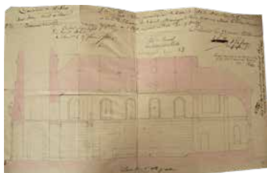
Plan de l'architecte Sassard