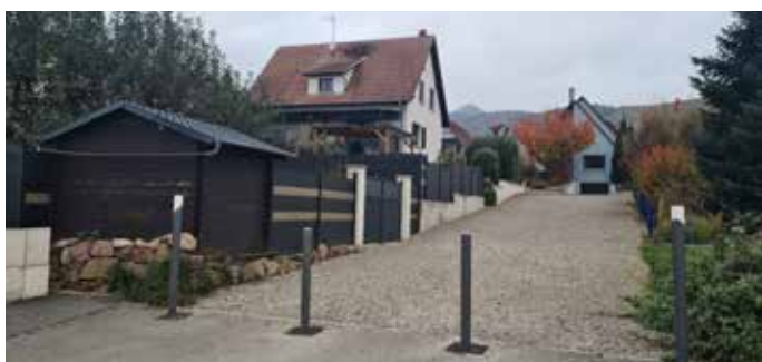
Jonction Rue des Acacias Zellmatten