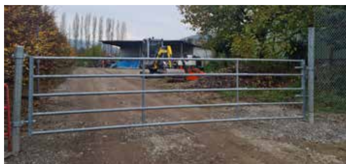
Installation d'un nouveau portail d'accès au hangar communal