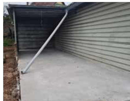
Préparation de la dalle, recevant les futurs récupérateurs d'eau communaux