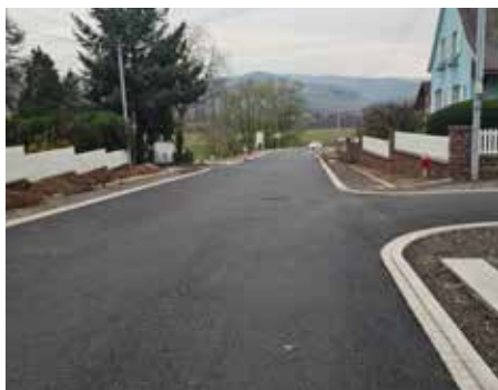
Sécurisation de l'entrée ouest du village sur la RD10

Depuis début juillet, différents travaux, principalement de voirie, ont été menés. Voici un retour en photos de ces différents chantiers.