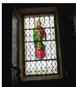
Saint-Paul - sacristie