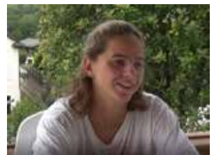
Nageuse de l'Equipe de France Licenciée au Canet 66 23 ans - Licence STAPS Prépare un Master en Psychologie

Revenons sur certains points-clés de son parcours.