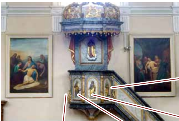
La chaire à prêcher

Intéressons-nous plus particulièrement aux symboles des quatre évangélistes qui sont les principaux auteurs des évangiles de la Bible. Leurs symboles viendraient de la vision du prophète Ézéchiël où les sujets apparaissent chacun avec 4 faces et 4 ailes : un homme, un lion, un taureau et un aigle. Ils correspondent aussi aux premières pages de leurs écrits.