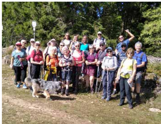
Dans le secteur de La Bresse le sommet du Grouvelin et lac de Lispach.