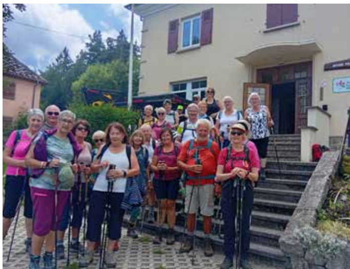
Du col du Wettstein au lac du Forlet au mois d'août.

Lors du séjour d'une semaine à Opatija en Croatie les participants ont pu visiter : l'amphithéâtre de Puja, le parc national de Plitvice où 16 lacs se déversent en cascades les uns dans les autres, l'île de Krk et les grottes de Potojna en Slovénie.