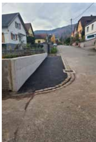
Alignement d'un mur rue de la Forêt