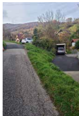
Réfection du ruissellement des eaux pluviales rue du Château – rue des Lilas