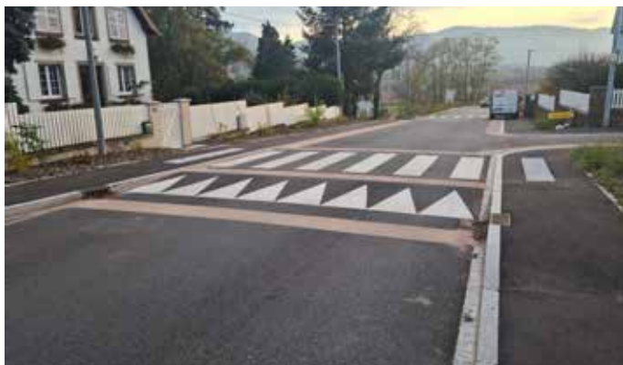
Travaux de sécurisation sur la RD10 aux entrées Est et Ouest