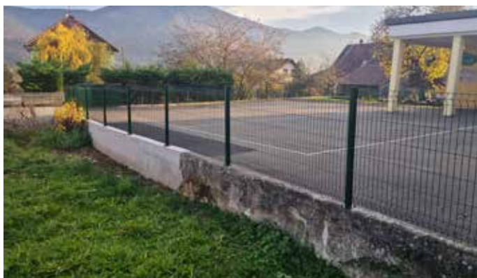
Travaux à l'école