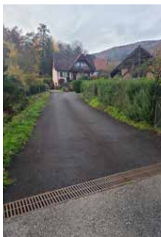
Aménagement rue des Prés