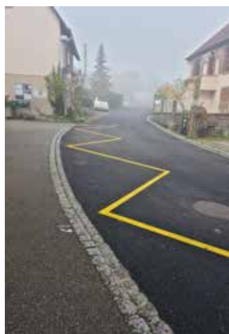
Voirie Rue de la Grotte