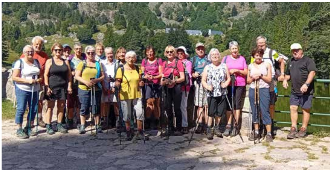
52 participants dans le secteur de Labaroche- Hohnack ce printemps.

Les visites du fondeur des cloches et d'un tourneur sur bois à Hohrod et de l'ambulance alpine à Mittlach étaient au programme de la sortie culturelle du 19 octobre.